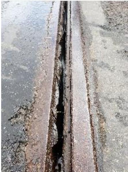
Abbildung 1: Korrodiertes Randprofil der Übergangskonstruktion mit gerissenem Dichtprofil/Gummi