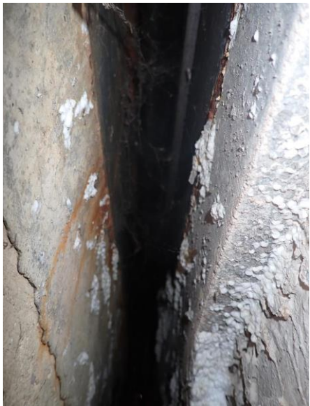
Abbildung 2: Korrodiertes Kantenprofil der Übergangskonstruktion